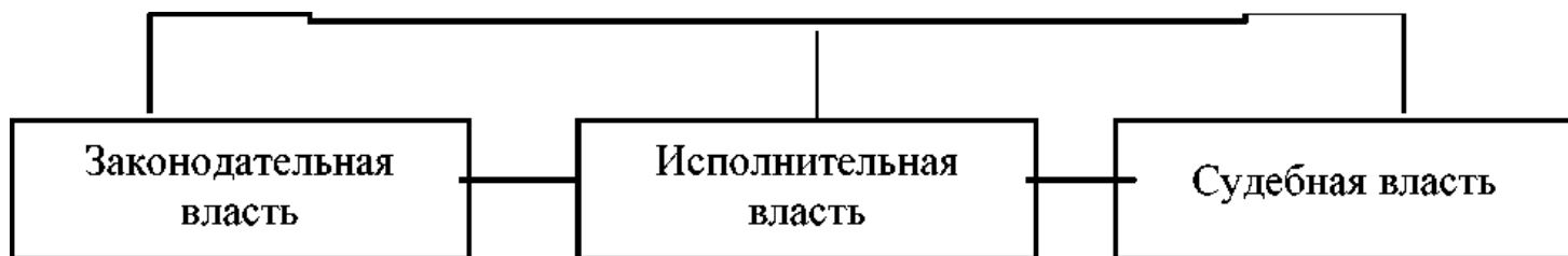
Рисунок 1. Система структуры государственного аппарата Российской Федерации

Однако, как показывает исторический опыт, реализация подобной концепции приводит не в демократии, а к диктатуре. Об этом свидетельствует, в частности, политическая практика фашистской Германии, Италии и ряда иных стран.